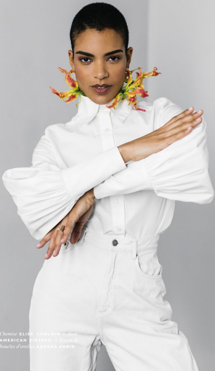
Chemise ELISE CHALMIN | Jean AMERICAN VINTAGE | Bague & boucles d'oreilles ANESKA PARIS