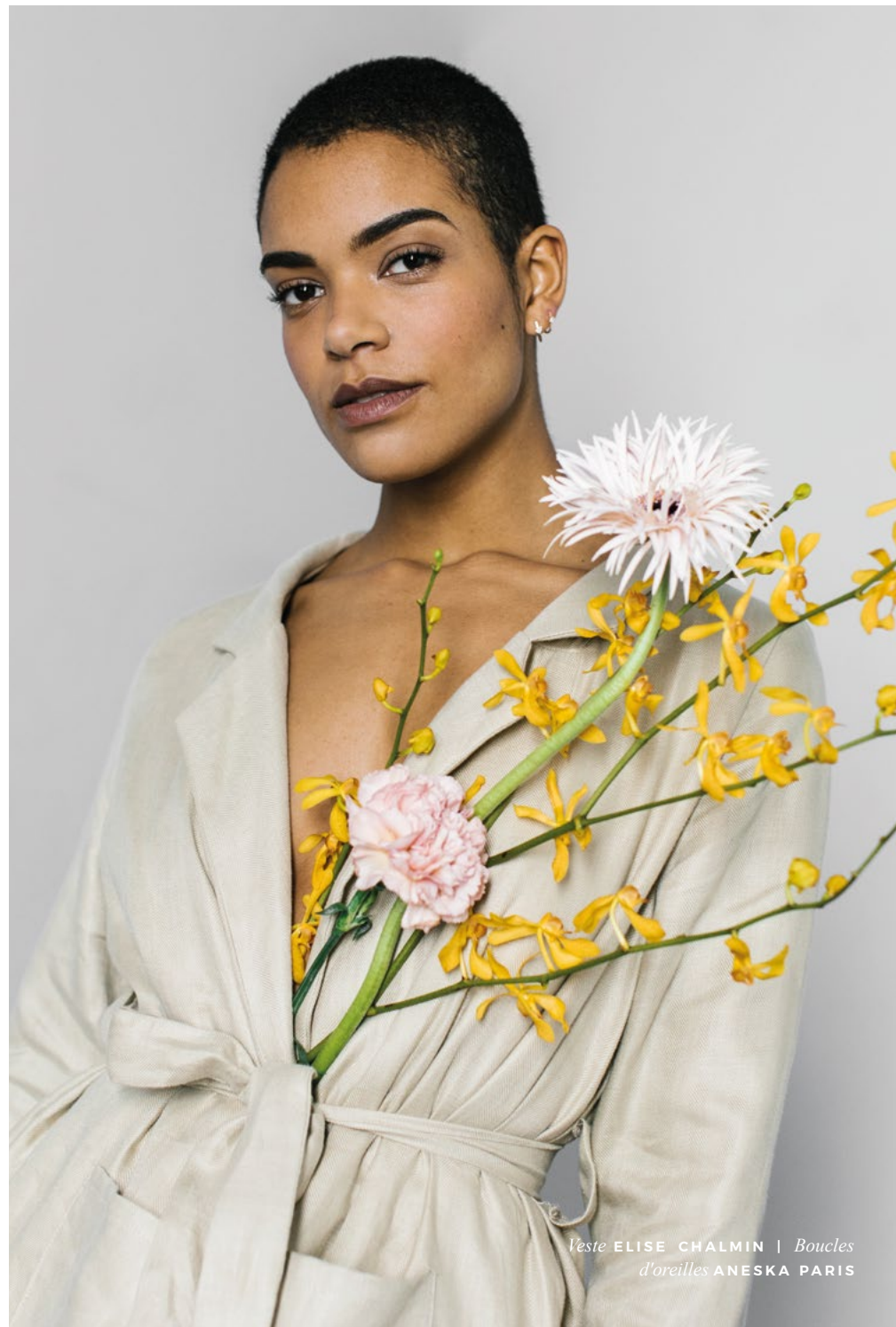
Veste ELISE CHALMIN | Boucles d'oreilles ANESKA PARIS