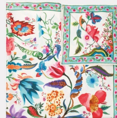
FOULARD THE TREE OF LIFE FERRAGAMO - 340€