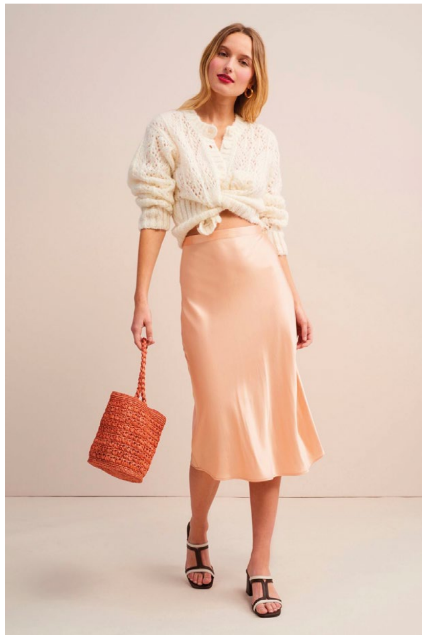
Le cardigan Lucas chez Rouje