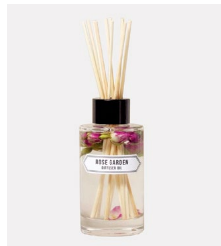
DIFFUSEUR NORFOLK ROSE GARDEN - 27$

Usage de circonstance : pour transformer sa maison en jardin botanique.