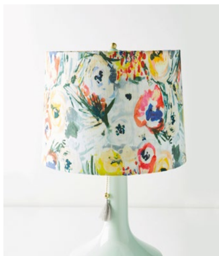
LAMPE ANTHROPOLOGIE - 78$

Usage de circonstance : pour végétaliser votre table de nuit.