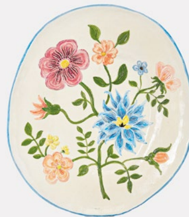
ASSIETTE ASTIER DE VILLATTE X NATHALIE LÉTÉ - 260€

Usage de circonstance : pour s'en mettre plein la vue avant la panse.