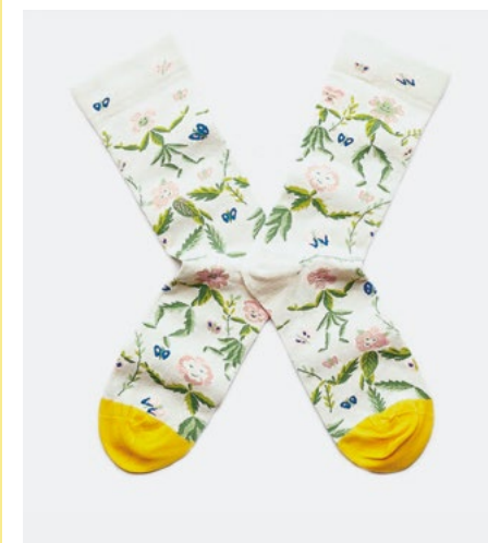
CHAUSSETTES BONNE MAISON - 19€